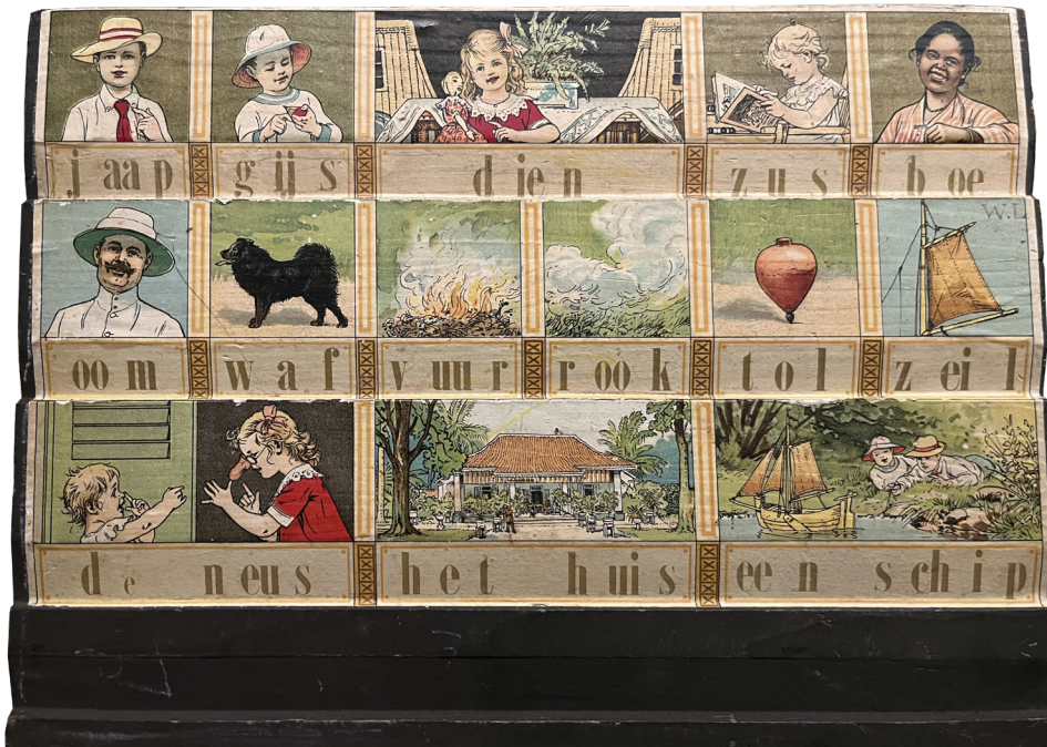
Leesplankje bij Hoogveen's leesmethode voor de scholen in Nederlands Oost-Indië, djati hout beplakt met papier, c. 1930-1940.

wordt afgewezen door de koloniale regering, maar op 17 augustus 1945 begint Indonesië aan de vrijheidstrijd.