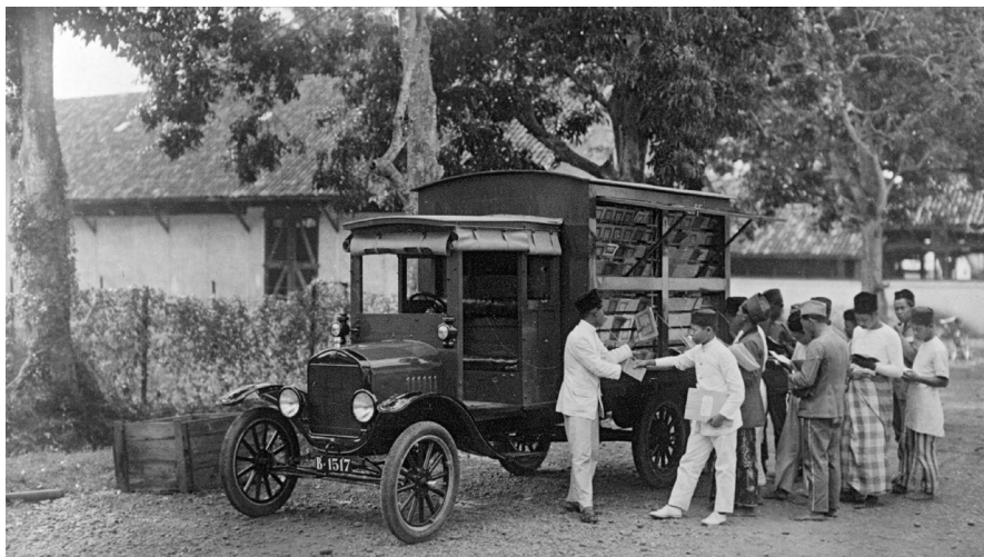
'De reizende bibliotheek', vermoedelijk jaren '30, fotograaf onbekend. Coll. Nationaal Museum van Wereldculturen (Tropenmuseum)