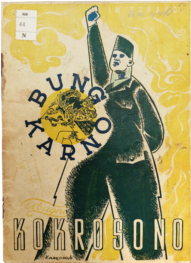
Imam Supardi, Bung Karno sebagai Kokrosono , Pustaka Nasional Surabaya, c. 1948.

Indonesische lontar-handschriften, geïllustreerde pustaha's van boombast, letterproeven van Javaanse letters, het eerste door een Indonesiër gedrukte boek uit 1827, koloniale schoolboeken, wetboeken voor 'Europeanen' en 'Inlanders', het Nederlands-Indisch oorlogsspel uit 1903 en revolutionair drukwerk. Deze grote hoeveelheid drukwerk geeft een intrigerende inblik in de ontwikkelingen binnen de (post)koloniale samenleving. Daarnaast maakt het duidelijk hoe scherp er gediscrimineerd werd en hoe het verlangen naar een vrij Indonesië allang voor de Indonesische revolutie in drukwerk werd vastgelegd. Van dat laatste getuigt onder meer het iconische, tweetalige vlugschrift 'Als ik eens Nederlander was...' van Soewardi Soerjaningrat uit 1913. Het pamflet is een sarcastisch protest tegen de plannen van de Nederlandse koloniale regering om de Nederlandse 100-jarige onafhankelijkheid van Frankrijk te vieren. Het was de bedoeling om de Indonesiërs aan deze viering te laten meebetalen, maar dat leverde protest op. Want hoe kun je de vrijheid van een land vieren, dat zelf een ander land heeft gekoloniseerd? Er is slechts een exemplaar bewaard gebleven en dat wordt bewaard in de collectie van de Universiteit Leiden. Het facsimile kan in de tentoonstelling worden doorgebladerd!